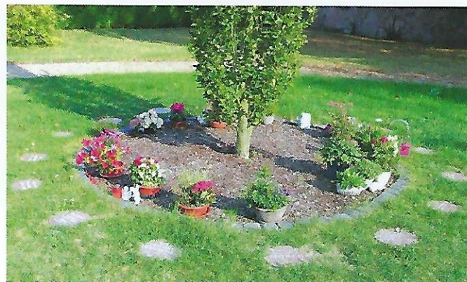
Gestaltungsbeispiel: In der Mitte ein schmal wachsender Baum mit einem Rindenmulchkreis drum herum. Dann können zwei Urnenkreise mit einheitlichen Grabplatten angelegt werden. Auf diesen kann man Schalen oder Blumensträuße ablegen.

Die SPD Lützelhausen ist sehr erfreut, dass die Wünsche und Nachfragen aus der Bevölkerung zu einer alternativen Grabform jetzt umgesetzt werden können.